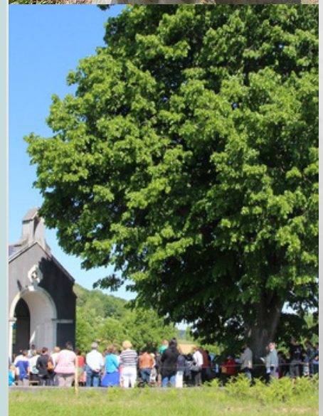
Tilleul de la Chapelle du Piétat Lamarque-Pontacq